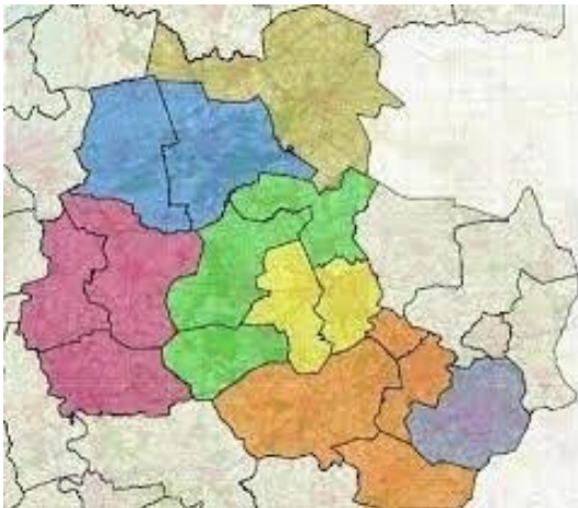
Afbeelding 1. Een overzicht van de Agrarische Natuur verenigingen in Overijssel. In Oranje het werkgebied van Hooltwark.

Agrarische Natuurvereniging Hooltwark zet zich in voor natuur en landschap, waarbij een goede balans tussen agrarische belangen en natuurwaarden centraal staan. Onze vereniging is van mening dat boeren een prominente rol moeten spelen bij natuur- en landschapsbeheer.