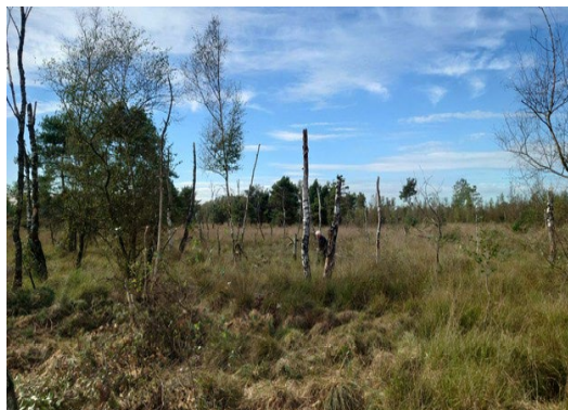
20 Ha. Witte Veen!

De werkploeg en vrijwilligers bestaande uit leden van de ANV hebben in 2023 diverse werkzaamheden uitgevoerd.